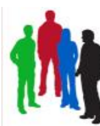
CONSEJO DE SOSTENIBILIDAD