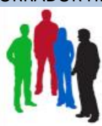
CONSEJO DE SOSTENIBILIDAD