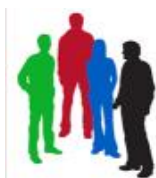
CONSEJO DE SOSTENIBILIDAD