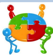
MESAS DE TRABAJO