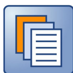
DOCUMENTO PROPOSITIVO DEFINITIVO