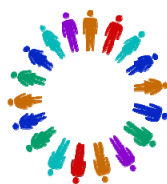
I CONFERENCIA ESTRATEGICA