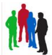
CONSEJO DE SOSTENIBILIDAD