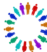
PRESENTACION AL PÚBLICO