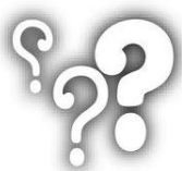
ENCUESTA A LA CIUDADANÍA